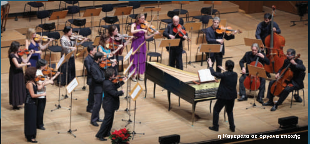
η Καμεράτα σε όργανα εποχής

Η Καμεράτα, δίσταση για τις εξαιρετικές της ερμηνείες στα μεγαλύτερα μουσικά κέντρα της Ευρώπης, παρουσιάζει υπό την διεύθυνση του καλγκου της διευθυντή Γιώργου Πέτρου, δύο αριστουργηματικά έργα της κλασικής εποχής.