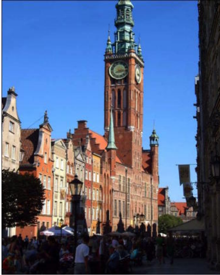
η πλατεία της αγοράς

Θα μπορούσαμε να διασχίσουμε σπιθαμή προς σπιθαμή την υπέροχη αυτή χώρα ανακαλύπτοντας και υπογραμμίζοντας σημαντικά πράγματα γύρω από τη μουσική και την εκπαίδευση, η Πολωνία ήταν και παραμένει ένας από τους σοβαρότερους εκπαιδευτικούς μουσικούς τόπους, αλλά θα επαναλαμβάναμε πολλές φορές τα ίδια πράγματα.