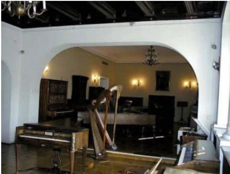
μία αίθουσα του μουσείου οργάνων.

Ιδιαίτερη μνεία οφείλουμε -ως μουσικοί- στο Μουσείο Οργάνων του Πόζναν που είναι το τρίτο μεγαλύτερο στην Ευρώπη και έχει κεντρική θέση στο τετράγωνο της παλιάς πόλης (Stary Rynek 45, 61-772 Poznań). Θαυμάζει εκεί ο επισκέπτης 2000 τουλάχιστον μόνιμα εκθέματα.