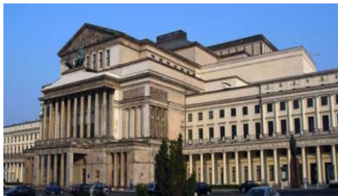
Μεγάλο Θέατρο της Βαρσοβίας: Opera narodowe - Teatr Wielki pl. Teatralny 1, P. O. Box 59 - 00 - 950 Warszawa

Rector: tel. 827 83 03, 827 72 41 ext. 255 fax 827 83 10 e-mail: rektor@chopin.edu.pl Pro-rector for Teaching Affairs: tel. /fax 827 83 06, tel. 827 72 41 ext. 238. e-mail: prorektor-st@chopin.edu.pl Prorector for Students' and Foreign Affairs: tel./fax 827 83 06, tel. 827 72 41 ext. 238 e-mail: prorektor-zagr@chopin.edu.pl Deputy Director: tel. 827 72 41 ext. 303, e-mail: jarmulaj@chopin.edu.pl Pedagogical Studies: tel. 827 72 41 ext. 265. Main Library: tel. 827 72 48 ext. 234 (reading room), 271 (lending room), e-mail: biblioteka@chopin.edu.pl Teaching Management and Students' Affairs: tel. 826 46 34, 827 72 41 ext. 212