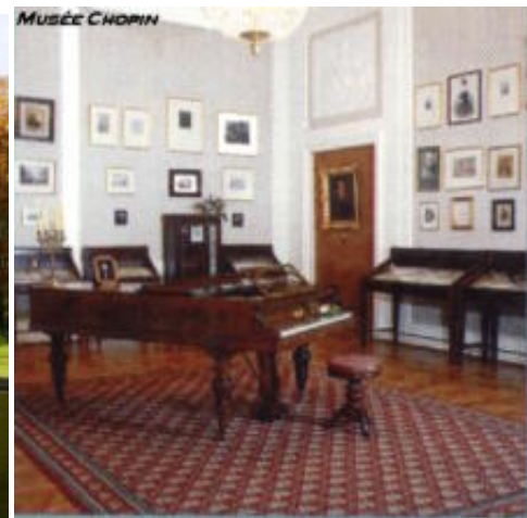
Lazienki, μνημείο Φρειδερίκου Σοπέν και δεξιά το πιάνο των Σοπέν και Λιστ στο Μουσείο

Οι εκδρομές των τουριστών που... σέβονται τον εαυτό τους ξεκινούν από το μουσείο Σοπέν, στο κέντρο της Βαρσοβίας, στο Παλάτι d'Ostrogscy, και μέσω της βασιλικής οδού οδηγούν στην εκκλησία όπου φυλάσσεται η καρδιά του. Στη συνέχεια επισκέπτονται το μνημείο του, στον βασιλικό κήπο Lazienki .