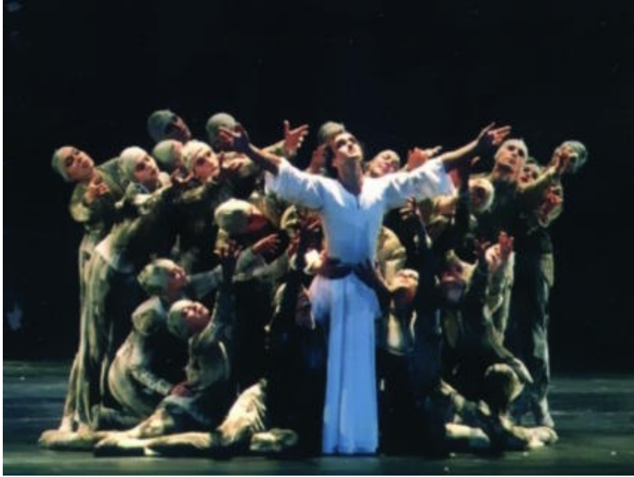
Φεστιβάλ των τεσσάρων πολιτισμών, Μεγάλο Θέατρο, 2003 Μπαλέτο του Αιφμαν

Στο Katowice ας μεταφερθούμε για λίγο, στο νότο. Τριακόσιες χιλιάδες κάτοικοι, πέντε θέατρα, πέντε συμφωνικά σχήματα, δέκα μουσεία, άλλες τόσες γκαλερί.