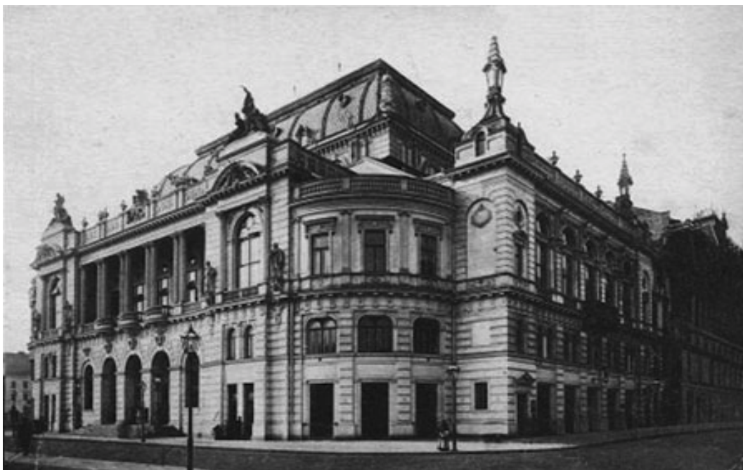
παλιά φωτογραφία του θεάτρου της Φιλαρμόνια στη Βαρσοβία (Filharmonia narodowa) ul. Jasna 5 - 00-950 Warszawa

Η Βαρσοβία και η Κρακοβία συντροφεύονται στις μουσικές προσπάθειες από τριάντα ακόμα ισότιμα ιδρύματα σε άλλες πόλεις, που εργάζονται με τον ίδιο απέρητο και σοβαρό τρόπο, δεκαετίες τώρα. Στα περισσότερα ιδρύματα της χώρας αυτής, κονσερβατόρια και θεωρητικά τμήματα πανεπιστημιακού επιπέδου, η ποιότητα παραμένει νόμος. Τα πιο γνωστά εξ αυτών: Akademia Muzyczna im. Feliksa Nowowiejskiego w Bydgoszczy, Akademia Muzyczna im. Fryderyka Chopina – Filia w Białymstoku, Akademia Muzyczna im. Ignacego Jana Paderewskiego w Poznaniu, Akademia Muzyczna im. Grażyny i Kiejstuta Bacewiczów w Łodzi, Akademia Muzyczna im. Karola Szymanowskiego w Katowicach, Akademia Muzyczna im. Stanisława Moniuszki w Gdańsku, Instytut Kultury i Sztuki Muzycznej - Uniwersytet Zielonogórski, Instytut Muzyki - Pomorska Akademia Pedagogiczna w Słupsku, Instytut Muzykologii - Katolicki Uniwersytet Lubelski, Katedra Muzyki - Uniwersytet Warmińsko-Mazurski.