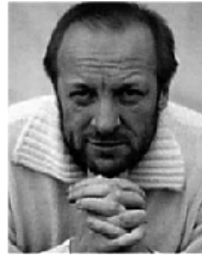
W. Lutoslawski (1913-1994)