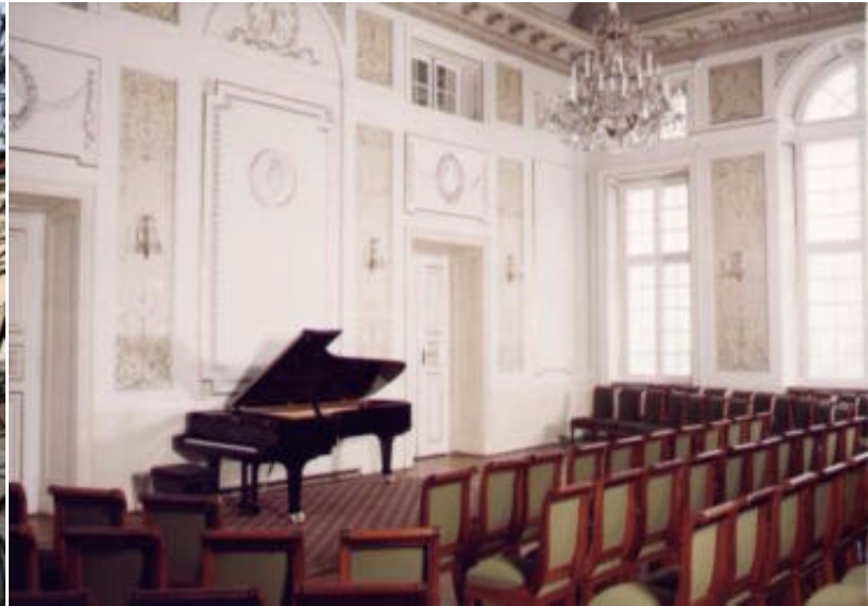
Ακαδημία Σοπέν στη Βαρσοβία, δεξιά η αίθουσα Σοπέν

Η Βαρσοβία έχει 58 αίθουσες συναυλιών και 50 μουσεία, μερικά εκ των οποίων φιλοξενούν μουσικές εκδηλώσεις διαρκώς. Έχει επίσης 14 πολιτιστικούς οργανισμούς, 61 πολιτιστικά κέντρα και 48 βιβλιοθήκες για το κοινό, 16 εφημερίδες που όλες έχουν μουσικές στήλες, ακόμα και οι αθλητικές, 4 ραδιοφωνικά προγράμματα και δύο τηλεοπτικά.