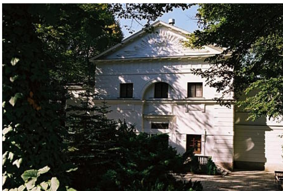
η όπερα δωματίου της Βαρσοβίας

Η Βαρσοβία και η Κρακοβία συντροφεύονται στις μουσικές προσπάθειες από τριάντα ακόμα ισότιμα ιδρύματα σε άλλες πόλεις, που εργάζονται με τον ίδιο απέρητο και σοβαρό τρόπο, δεκαετίες τώρα. Στα περισσότερα ιδρύματα της χώρας αυτής, κονσερβατόρια και θεωρητικά τμήματα πανεπιστημιακού επιπέδου, η ποιότητα παραμένει νόμος. Τα πιο γνωστά εξ αυτών: Akademia Muzyczna im. Feliksa Nowowiejskiego w Bydgoszczy, Akademia Muzyczna im. Fryderyka Chopina – Filia w Białymstoku, Akademia Muzyczna im. Ignacego Jana Paderewskiego w Poznaniu, Akademia Muzyczna im. Grażyny i Kiejstuta Bacewiczów w Łodzi, Akademia Muzyczna im. Karola Szymanowskiego w Katowicach, Akademia Muzyczna im. Stanisława Moniuszki w Gdańsku, Instytut Kultury i Sztuki Muzycznej - Uniwersytet Zielonogórski, Instytut Muzyki - Pomorska Akademia Pedagogiczna w Słupsku, Instytut Muzykologii - Katolicki Uniwersytet Lubelski, Katedra Muzyki - Uniwersytet Warmińsko-Mazurski.