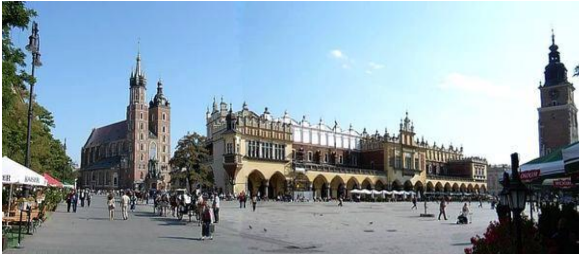
η πλατεία της αγοράς στην Κρακοβία

Από τα πρώτα -αν όχι το πρώτο- σημείο αναφοράς στην Κρακοβία της νότιας Πολωνίας με τους 800.000 κατοίκους πάνω -κάτω, που θα σας το δείξουν με περηφάνια οι ντόπιοι, είναι ασφαλώς τα μουσικά σχολεία τους και το περίφημο θέατρο της όπερας. Με χιούμορ θα σας επαναλάβουν την παροιμία που θέλει τους Πολωνούς να κατοικούν δύο κόσμους, την πατρίδα και τη μουσική!