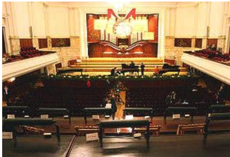
από το Concours Chopin 2005

Θρυλικός θεωρείται ο διαγωνισμός πιάνου που διεξάγεται από το 1927. Δίπλα του δεκάδες άλλες δημιουργικές ιδέες, σ' ένα τόπο που μόνο ήρεμα και ειρηνικά δεν διήγε την πολιτική και κοινωνική του ιστορία. Κι όμως κρατήθηκε γερά στη δύναμη των Τεχνών όσο λίγοι λαοί και κανείς δεν μπορεί να αμφισβητήσει την παρατήρηση αυτή, που ασφαλώς δεν είναι μόνον δική μου... Διαβάστε τα σχετικά με τους διαγωνισμούς τους προγραμματισμένους για τα έτη 2008 και 2009 στην ιστοσελίδα του Κέντρου Πληροφοριών για την Πολωνική μουσική: www.polmic.pl/index.php?option=com_mwkonkursy&view=konkursy&Itemid=10&lang=en