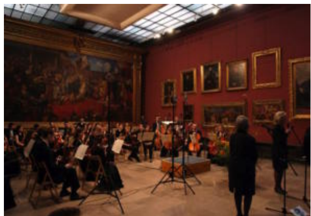
συναυλία στο τμήμα μουσικής δωματίου - 2004 -Sala Holdu Pruskiego w Sukiennicach.