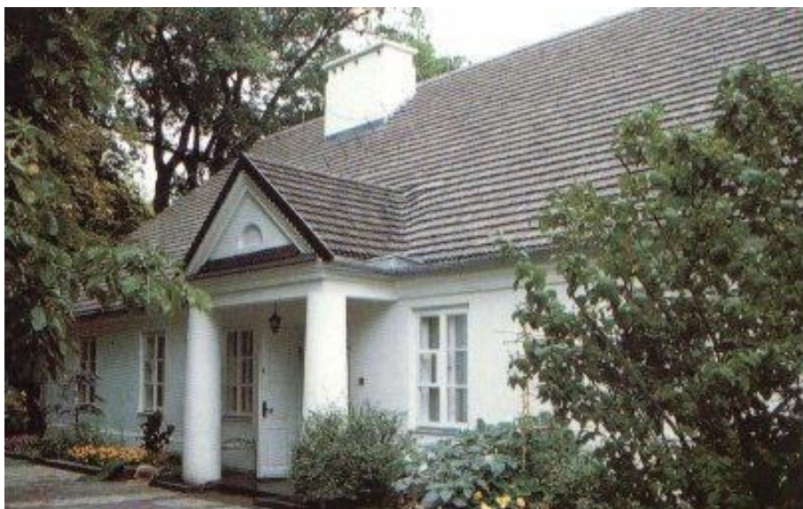
Zelazona Vola, το σπίτι του Σοπέν

συμπατριώτες του και το τιμούν όσο πιο συμβολικά γίνεται οι εκατοντάδες επισκέπτες του, κάθε μέρα.