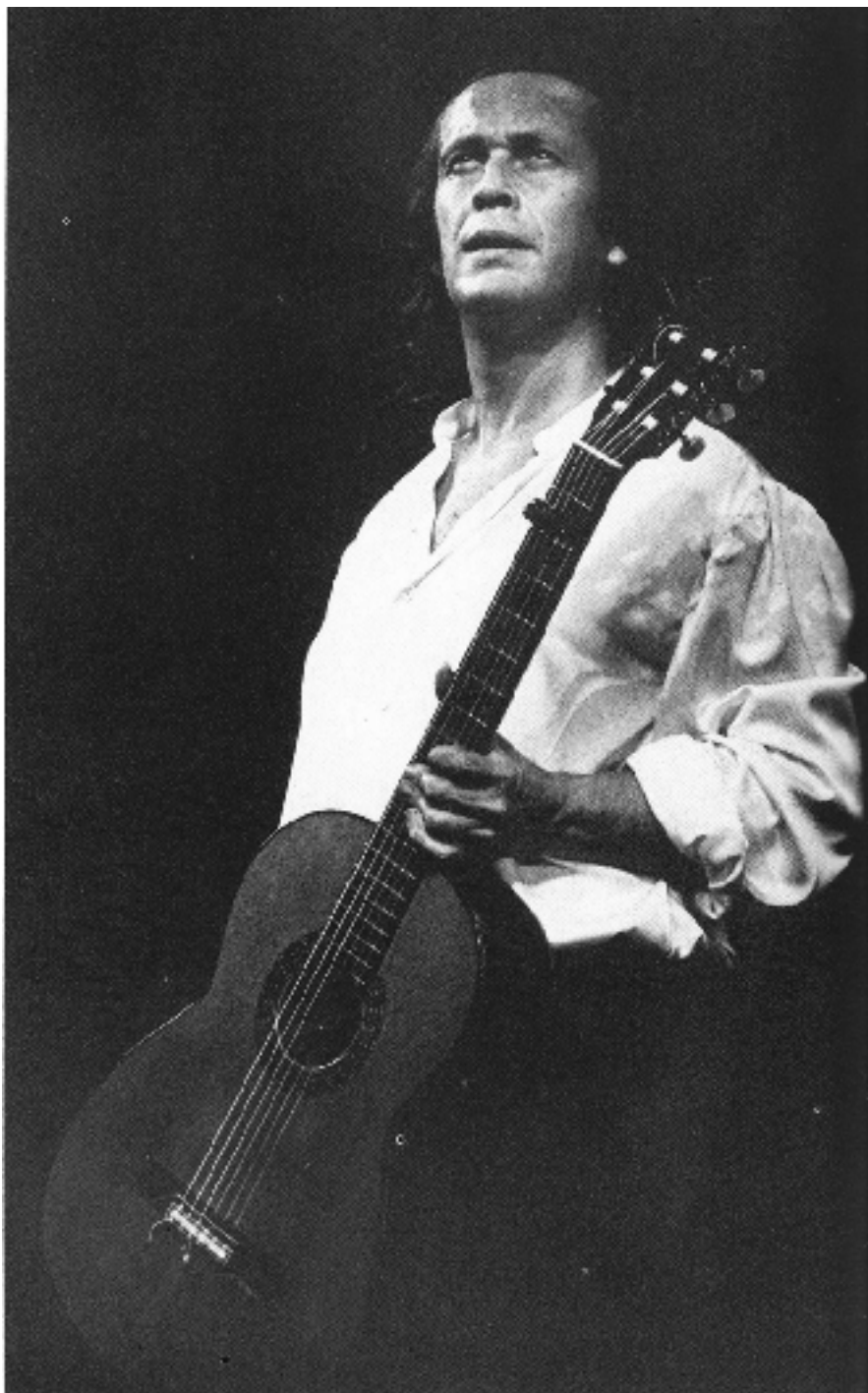
O PACO TOY 1986