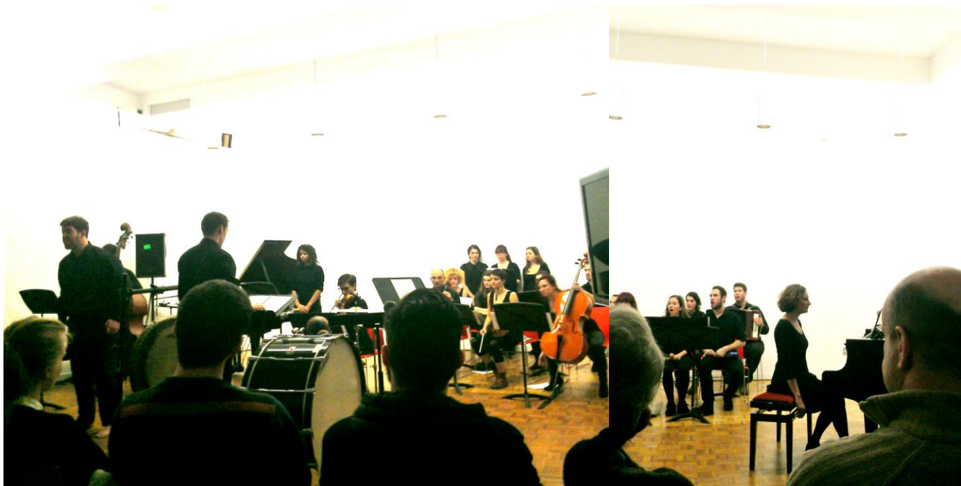
Στιγμιότυπα από την παράσταση του Βαρύτονου και του Πιανίστα από τους Oiseaux Bizarres Ensemble

Ήταν συγκινητικό να βλέπει κανείς λάτρεις της μουσικής του Χρήστου να συναντιούνται στο Λονδίνο, μέσα από μια προσπάθεια που έγινε με πολύ σκληρή δουλειά, μέσα σε αντίξοες συνθήκες αλλά και με την υποστήριξη πολλών ανθρώπων που μοιράζονται το ίδιο πάθος για τις ιδέες του Γιάννη Χρήστου. Και φυσικά ακόμα πιο συγκινητικό ήταν να βλέπει κανείς ανθρώπους από όλον τον κόσμο να έρχονται με τόσο ενθουσιασμό σε επαφή για πρώτη φορά με τη σκέψη αυτού του μοναδικού καλλιτέχνη, να εκτιμούν το έργο του και να εμπνέονται από αυτόν 43 χρόνια μετά το θάνατό του. Το μήνυμα που έστειλε η επιτυχία αυτού του συνεδρίου ήταν πως η μουσική του Γιάννη Χρήστου δεν ανήκει στα μουσειακά είδη αλλά αφορά τους νέους καλλιτέχνες και το κοινό του σήμερα, αξίζει διεθνούς αναγνώρισης και παραμένει ενδιαφέρουσα και στον 21 ο αιώνα.