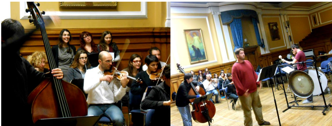
Στιγμιότυπα από τη γενική πρόβα των Oiseaux Bizarres Ensemble για το Βαρύτονο

Ήταν συγκινητικό να βλέπει κανείς λάτρεις της μουσικής του Χρήστου να συναντιούνται στο Λονδίνο, μέσα από μια προσπάθεια που έγινε με πολύ σκληρή δουλειά, μέσα σε αντίξοες συνθήκες αλλά και με την υποστήριξη πολλών ανθρώπων που μοιράζονται το ίδιο πάθος για τις ιδέες του Γιάννη Χρήστου. Και φυσικά ακόμα πιο συγκινητικό ήταν να βλέπει κανείς ανθρώπους από όλον τον κόσμο να έρχονται με τόσο ενθουσιασμό σε επαφή για πρώτη φορά με τη σκέψη αυτού του μοναδικού καλλιτέχνη, να εκτιμούν το έργο του και να εμπνέονται από αυτόν 43 χρόνια μετά το θάνατό του. Το μήνυμα που έστειλε η επιτυχία αυτού του συνεδρίου ήταν πως η μουσική του Γιάννη Χρήστου δεν ανήκει στα μουσειακά είδη αλλά αφορά τους νέους καλλιτέχνες και το κοινό του σήμερα, αξίζει διεθνούς αναγνώρισης και παραμένει ενδιαφέρουσα και στον 21 ο αιώνα.