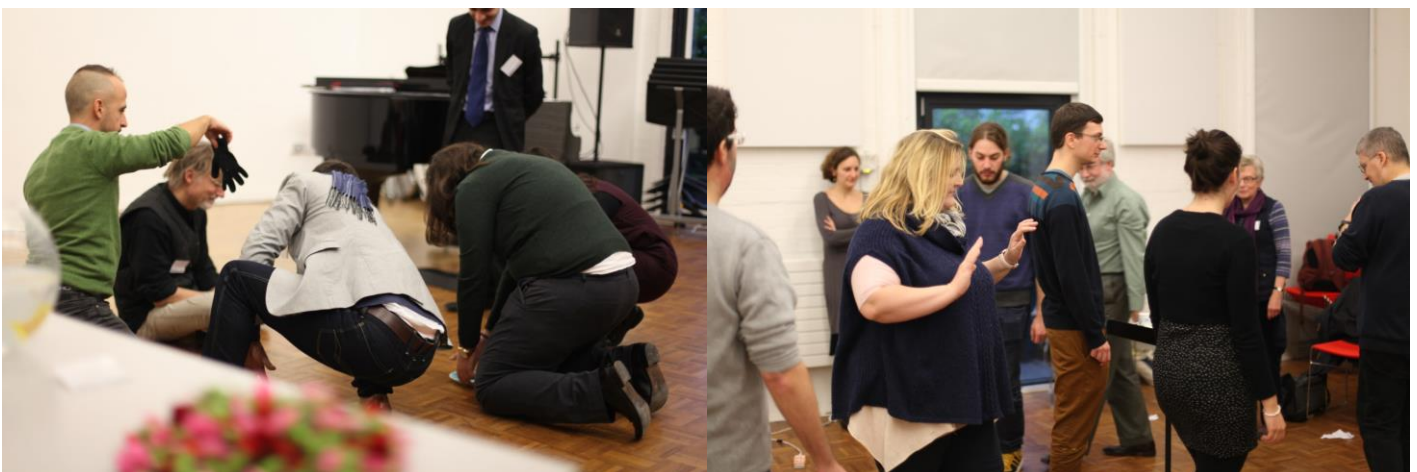
Στιγμιότυπα από το εργαστήριο When I grow up I want to be a Demiurge

Το συνέδριο άνοιξε το πρωί με πέντε ανακοινώσεις ερευνητών από Ελλάδα, Αυστρία, Γαλλία, Ηνωμένες Πολιτείες και Ηνωμένο Βασίλειο. Ο Γιάνος Ηλιάδης (υποψήφιος διδάκτορας του Ιονίου Πανεπιστημίου) μίλησε για το Μυστήριο του Γιάννη Χρήστου. Οι Βαρβάρα Γύρα (διδακτορικό από το Πανεπιστήμιο του Παρισιού) και Κωστής Καρπόζηλος (μεταδιδακτορικός ερευνητής στο Columbia University) εστίασαν στην πολιτικοκοινωνική διάσταση των έργων του συνθέτη. Ο Paul Attinello (καθηγητής στο Newcastle University) ασχολήθηκε με τη θέση του χρόνου, των ονείρων, και των αρχετύπων μέσα στα μουσικά έργα. Η Elfriede Reissig (καθηγήτρια στο Πανεπιστήμιο του Graz) ερεύνησε τη σχέση ανάμεσα στο έργο του Χρήστου και του Giacinto Scelsi, ενώ η Anne LeBaron (καθηγήτρια στο California Institute of the Arts) μίλησε για τη θέση των έργων του Χρήστου μέσα στην παράδοση του Μουσικού Θεάτρου και τον τρόπο που προσεγγίζει τα έργα του με τους φοιτητές της στις Ηνωμένες Πολιτείες.