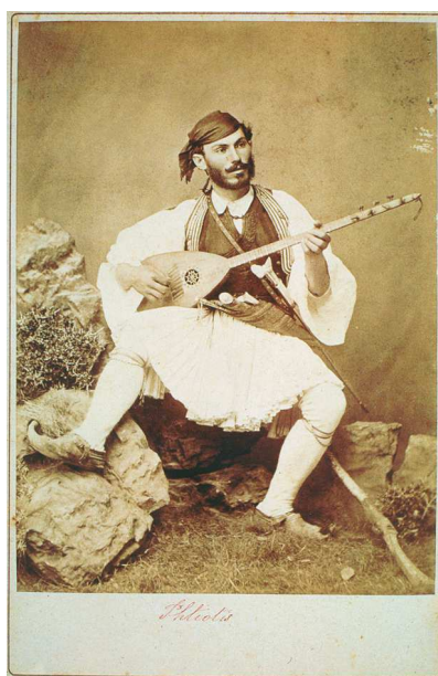
Φωτογραφία οργανοπαίκτη 1880 (Συλλογή μουσείου Μπενάκη).

Μια από τις σημαντικότερες μαρτυρίες του 19 ου αιώνα αποτελεί η φωτογραφία ενός μπουζουξή, που ανήκει στη συλλογή του Μουσείου Μπενάκη και η λήψη της τοποθετείται στα 1880. Η συγκεκριμένη φωτογραφία μετατράπηκε σε γκραβούρα και χρησιμοποιήθηκε από τον εκδότη και έμπορο μουσικών οργάνων Ζαχαρία Βελούδιο στο εξώφυλλο μιας σειράς μουσικών δελταρίων, με τίτλο Χοροί Ελληνικοί Δημώδεις , τα οποία κυκλοφόρησαν γύρω στα 1890. Το γεγονός αυτό υποδηλώνει σαφώς τη σχέση του οργάνου με το ρεπερτόριο της υπαίθρου.